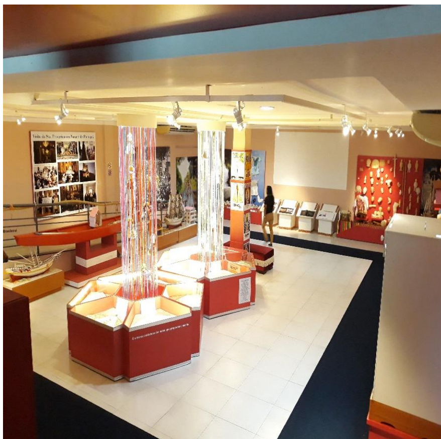
Figura 3: Memória de Nazaré