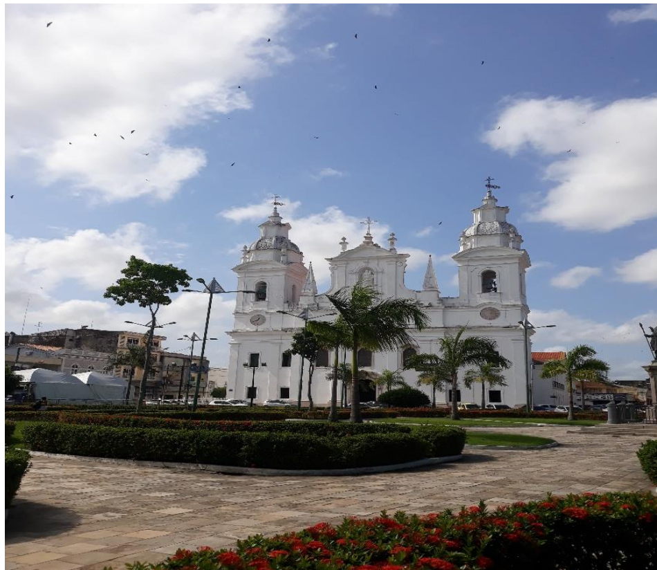
Figura 4: Catedral Metropolitana de Belém, Igreja da Sé