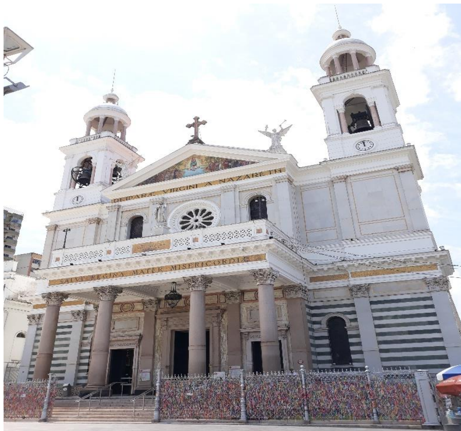
Figura 2: Basílica Santuário de Nossa Senhora de Nazaré