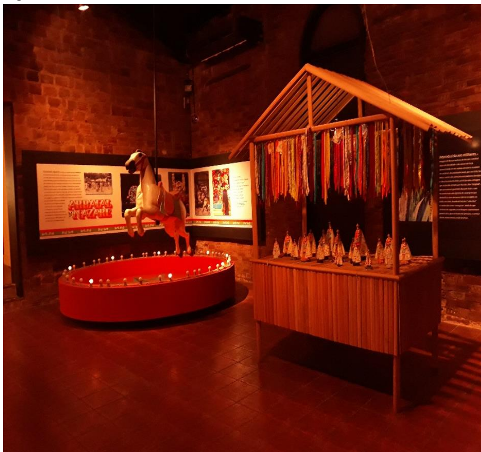
Figura 5: Museu do Círio